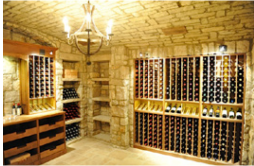
Cave à vins et Humidificateur Wine Guardian