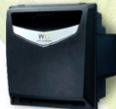
Umidificatore Dotato di Proprio Supporto