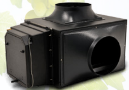
Systeme split canalisé avec humidificateur intégré en option