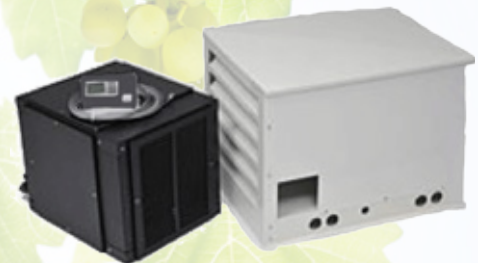
Unité de déshumidification (Gauche) et unité extérieure de condensation (Droite)