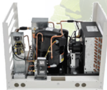
Unité de condensation avec couvercle accès-facile