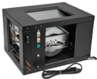
Panneau protecteur amovible pour accès facile