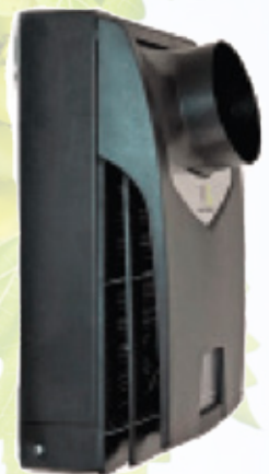
Ansicht der Rückseite mit optionalem Kanaladapter