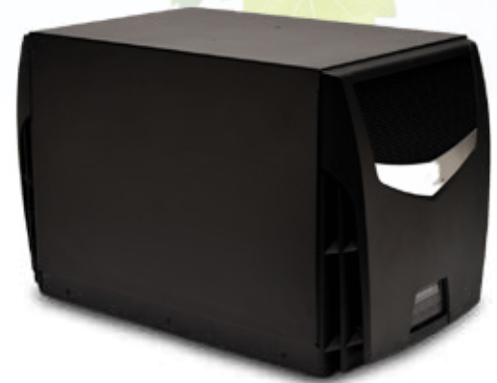
Unità TTW fuori dalla scaffalatura