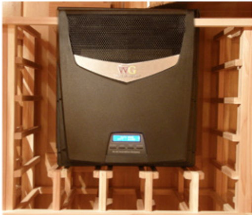
Vista frontale nella scaffalatura