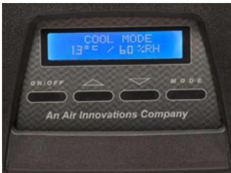
Display Digitale anteriore