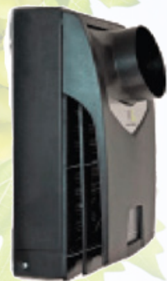
Vista posteriore con adattatore opzionale del condotto